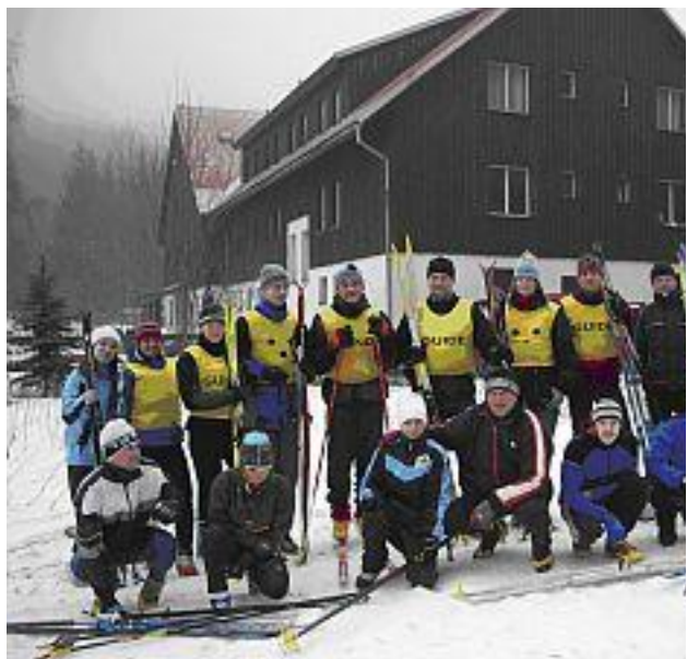
kurzu před chatou "Muhu" v Jindřichově v Jizerských horách, která se nachází v těsné blízkosti běžecských tratí.

Tento kurz jsme pořádali již druhým rokem a všichni byli přes nepřízeň počasí z prostředí Jindřichova nadšení. Traséři odvedli velmi dobrou práci a proto jsme si slíbili, že se na běžecských tratích areálu Břízky zase sejdem.