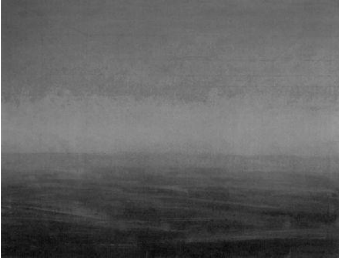
Bez názvu, Jan Smrž, 2008, olej na plátně