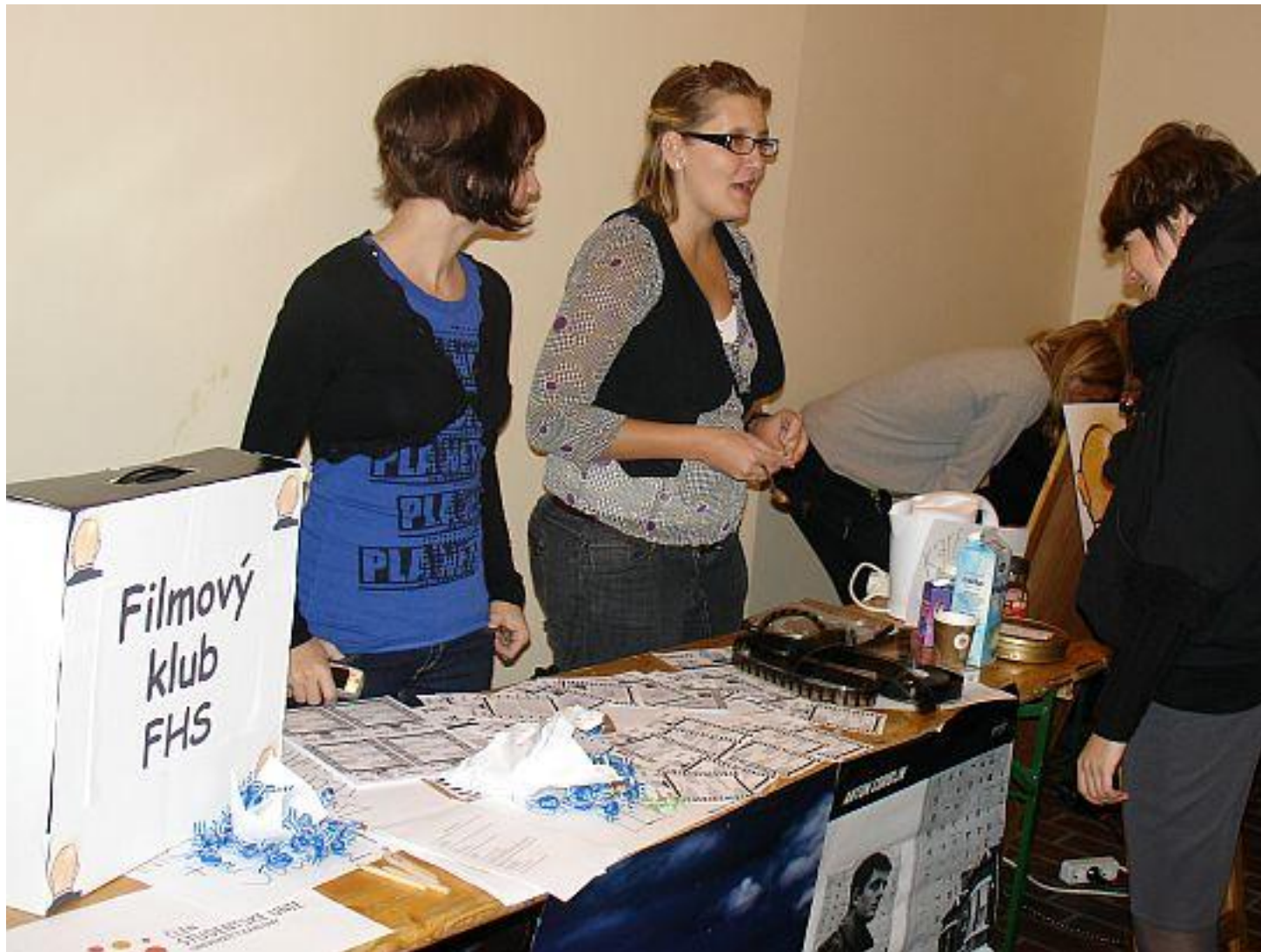
Filmový klub FHS sídlí v Jinonicích, promítá se každé druhé pondělí od 19.00 hodin. Promítání je přístupné studentům všech fakult.