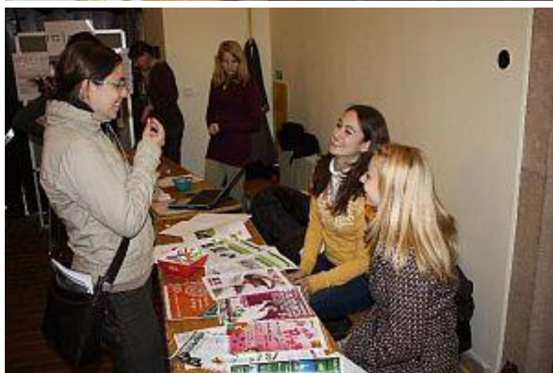
E-Klub je ekonomický klub studentů IES FSV. Pořádají zajímavé přednášky nad rámec výuky, sportovní akce a party pro studenty.