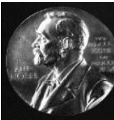
50 let od Nobelovy ceny za polarografii