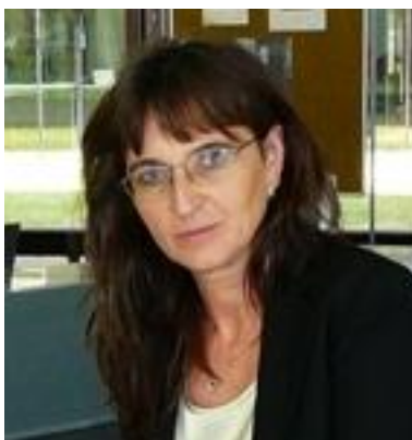
Výstava Příběh kapky připomene Jaroslava Heyrovského