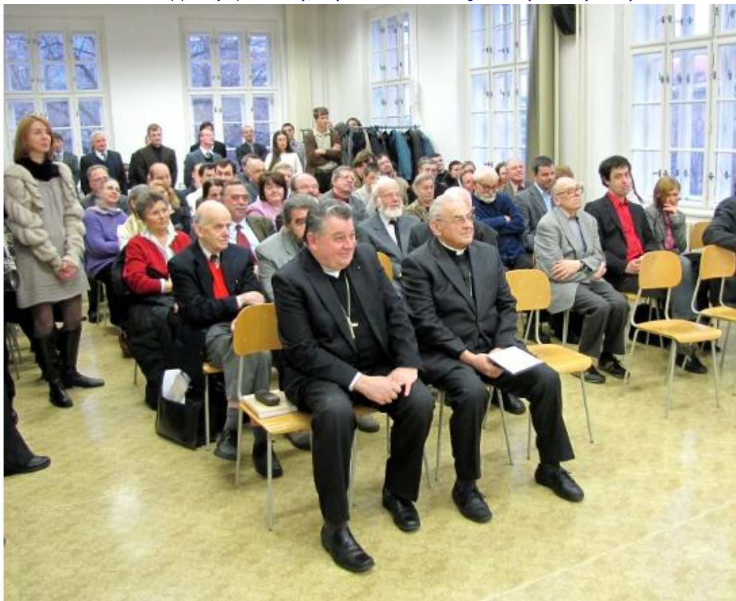
adventní setkání, Katolická teologická fakulta UK, 9. 12. 2009