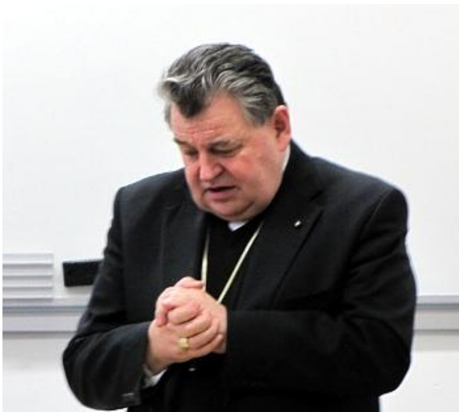
Jeho Excelence Mons. THLic. Dominik Duka, OP, biskup královéhradecký

Pedagogickou, vědeckou a publikační činnost Katolické teologické fakulty UK vysoce ocenil ve svém projevu také Jeho Excelence Mons. THLic. Dominik Duka, OP, biskup královéhradecký: „Dnes, kdy slavíme dvacet let svobody, neustále slyšíme o tom, co vše se nepodařilo a jestli všechny naše kroky byly smysluplné. I církev musela projít novými zkušenostmi a dialogem. Podařilo se nám ukázat, jaké jsou prameny teologického poznání. Myslím, že prvním důležitým krokem bylo zřízení Ústavu dějin křesťanského umění a dalším bylo posílení biblistiky, která má důležité postavení v Praze i Olomouci nejen v rámci teologických nauk. Dokladem toho bylo zřízení Centra biblických studií v Praze a jeho spolupráce s prestižní Princeton University. Přes všechny peripetie a těžkosti, kterými musela teologická fakulta projít, se dobré dílo podařilo a udělal se ohromný kus práce a to je základ dalšího rozvoje fakulty do budoucnosti. Můžeme mít radost.“