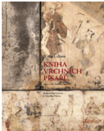
Olga Lomová: S'-ma Čchien: Kniha vrchních pisařů

Kniha vrchních pisařů (Š'-ti) je základním dílem čínské historiografie. Hovoří o Číně od mytických prvopočátků až po stabilizaci sjednocené říše za císaře Wu dynastie Chan (vládl 140–87 př. n. l.) a utváří obraz čínské civilizace, který dodnes určuje pohled Číňanů na vlastní minulost. Její autor S'-ma Čchien (asi 145–86 př. n. l.) prostřednictvím zaznamenaných událostí a osobních poznámek promýšlí otázky běhu dějin, vyšší spravedlnosti i toho, jak se má člověk správně rozhodovat v těžkých situacích.