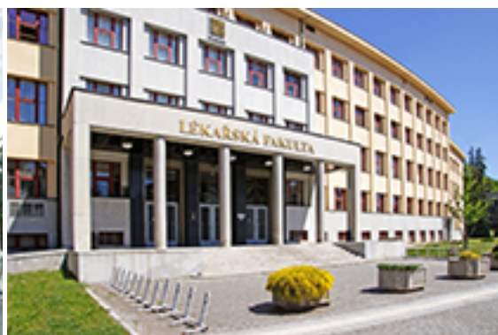
Lékařská fakulta v Hradci Králové