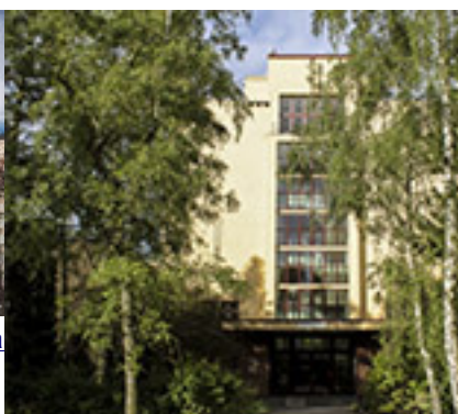
Husitská teologická fakulta