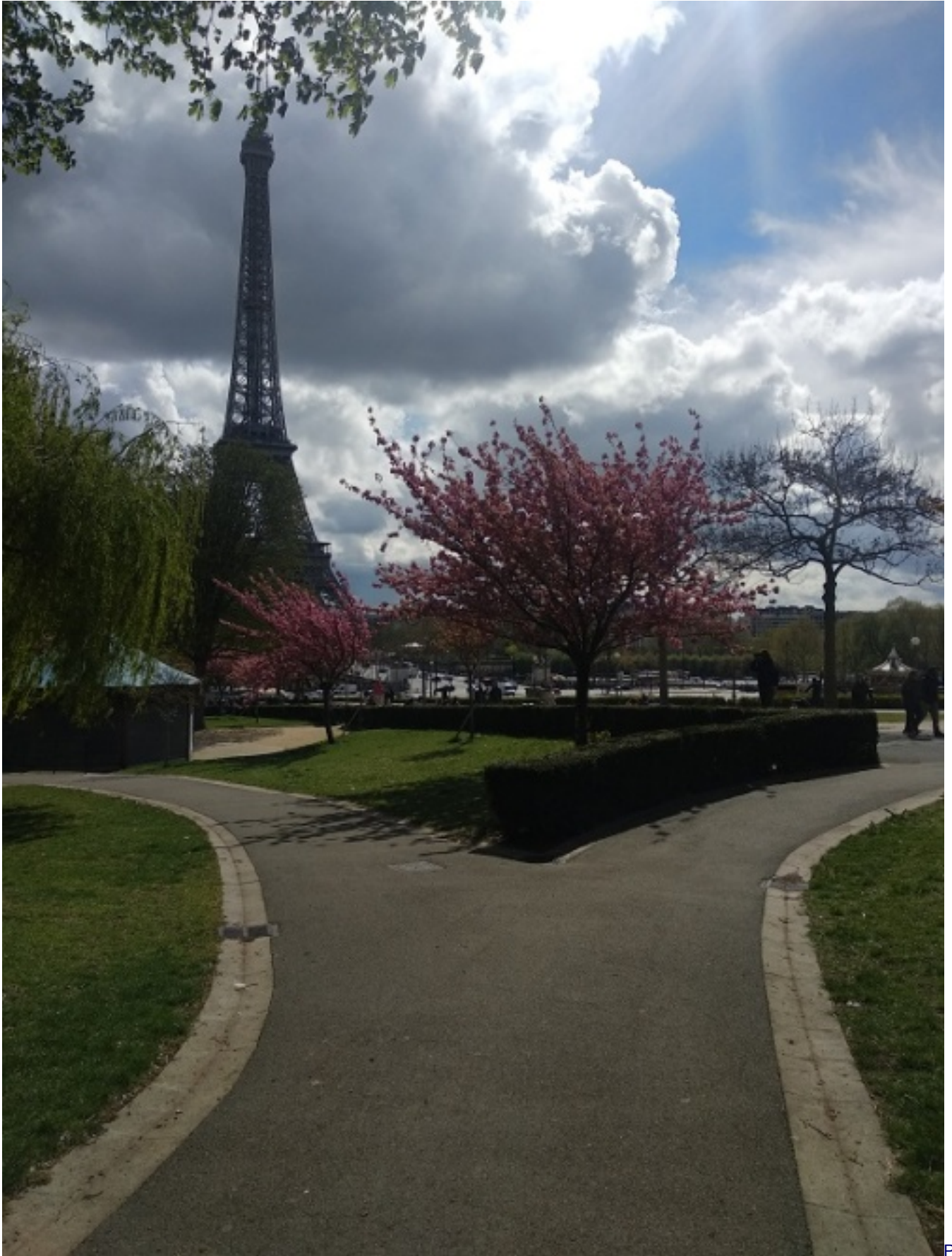
tamní školský systém je typické zadávat takzvané group works neboli skupinové projekty, kdy pracujete na zadaném