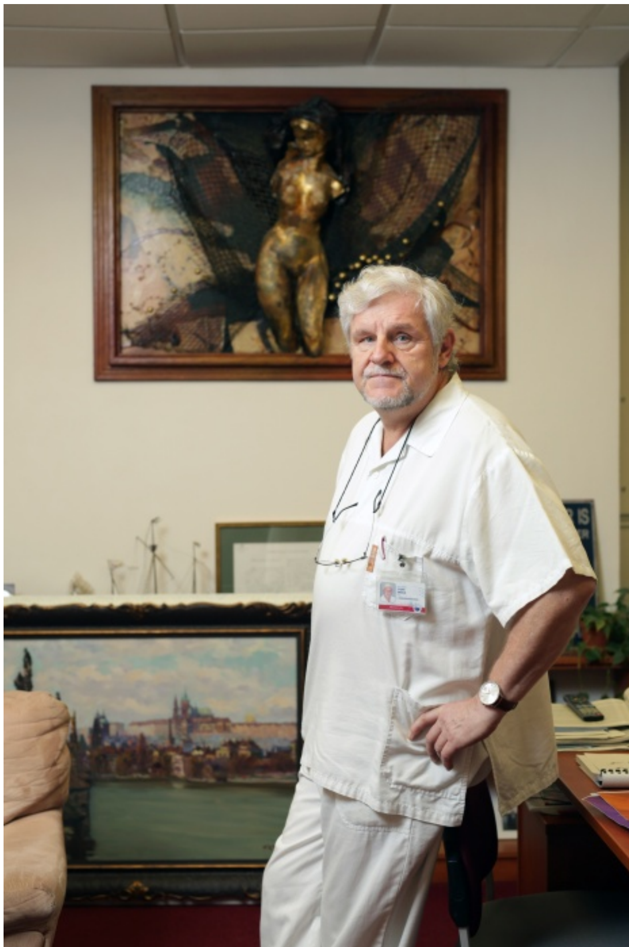
Kromě toho překládal a psal básně. Ze svých prostředků přispíval významně do sbírky na vznik Národního divadla, Ottova