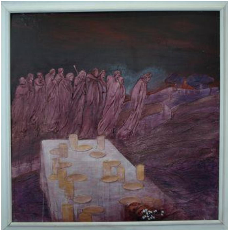
Jan Kristofori: Poslední večeře Páně, kombinovaná technika