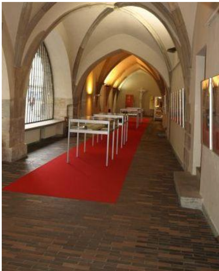
pohled do expozice Česká bible v průběhu staletí, 12. 3. – 12. 4. 2009, Karolinum, Praha