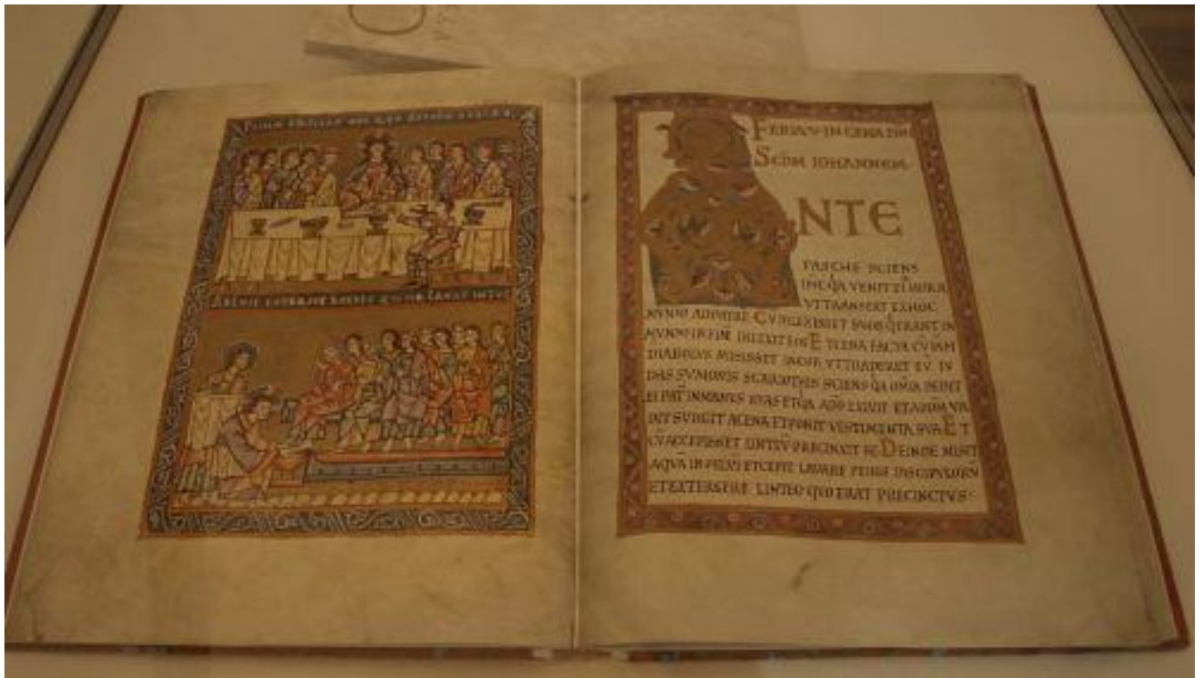
Vyšehradský kodex, korunovační evangeliář prvního českého krále Vratislava II. z r. 1085

slova nejznámějších oddílů bible, komentáře a mapy. Působivost literárních památek dokreslují ve vitrínách vystavené kalichy, poháry, misky a další hmotné památky liturgického charakteru.