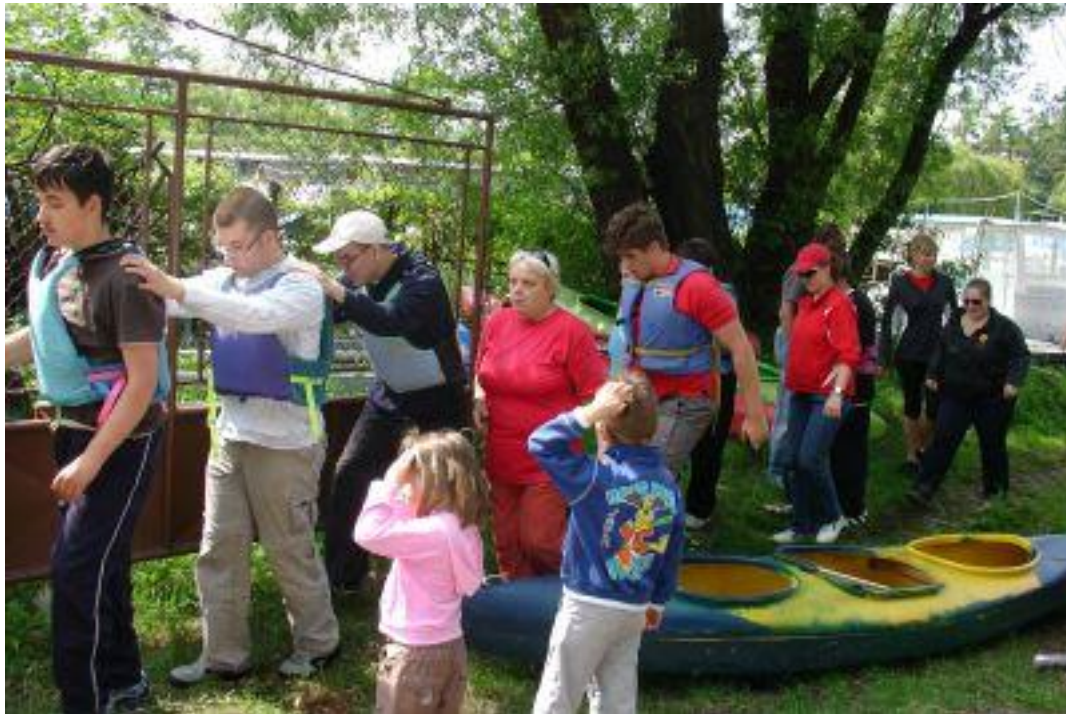
Ze školy Jaroslava Ježka letos do Podolí přicestovalo 10 chlapců