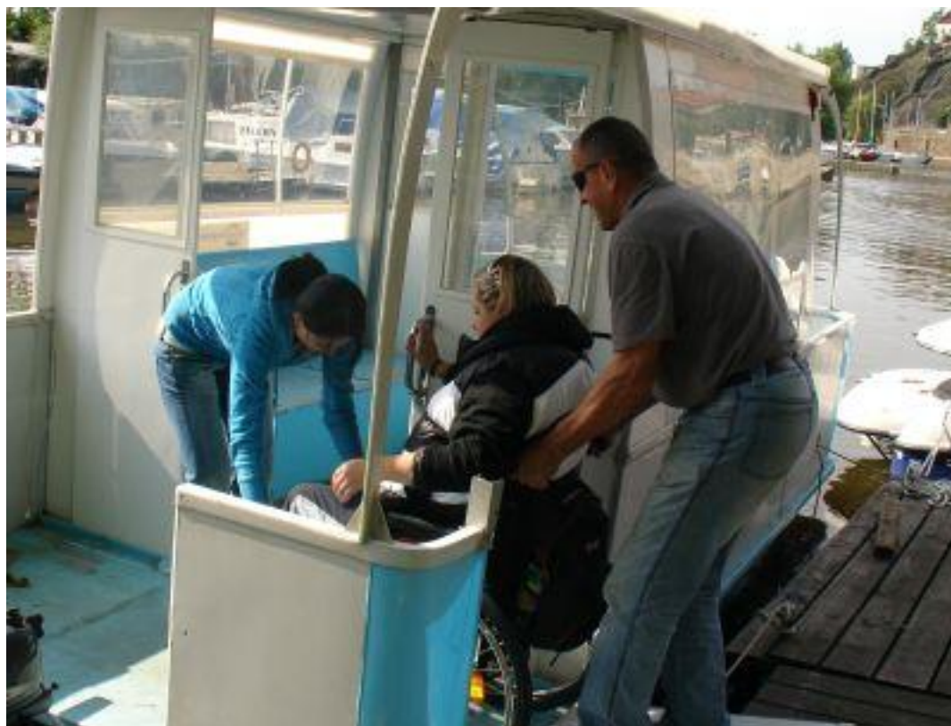
Klientky z Centra Paraple se zprvu obávaly, zda je speciální loď pro vozíčkáře dostatečně stabilní...