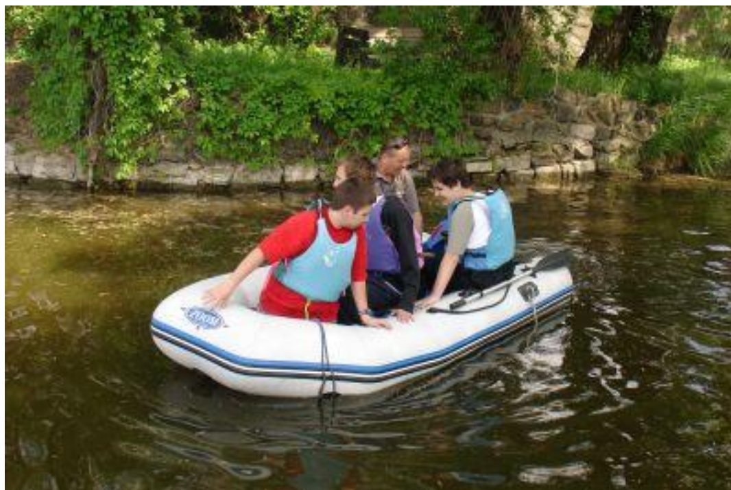
Největší oblibě se těšila jízda na motorovém člunu