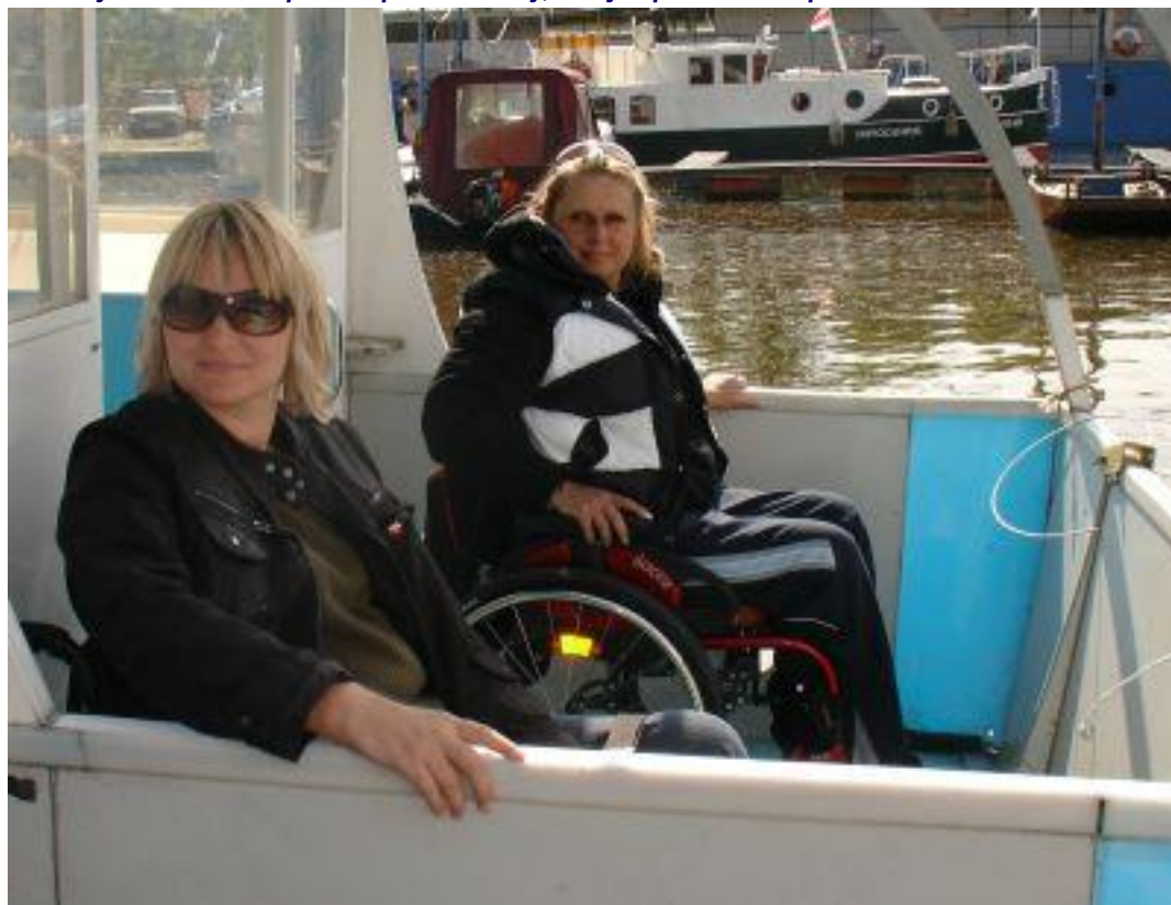
...pak ale byly z jízdy unešené