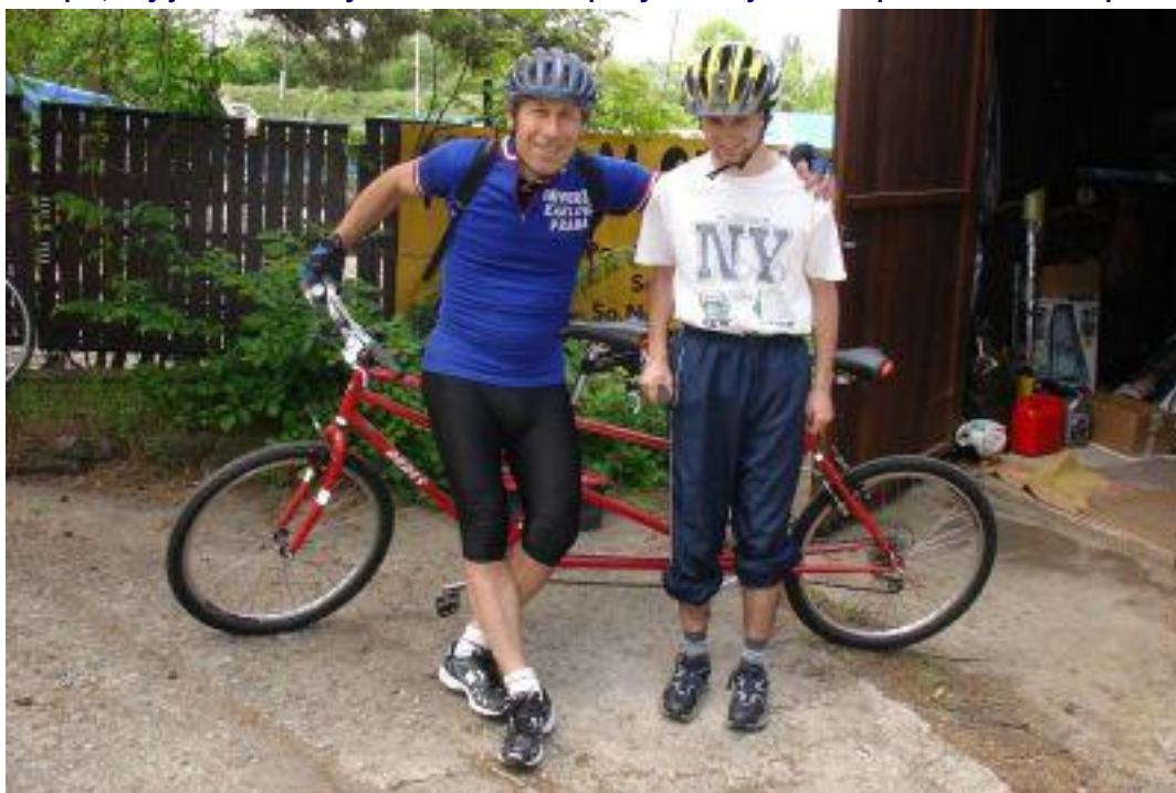
Nevidomé děti si mohly s asistentem vyjet na kole. Asfaltová cyklostezka vede přímo nad loděnicí

Studenti a vyučující pražských fakult UK se 13. května opět převlékli do sportovního, aby se zapojili do již tradičního Rektorského sportovního dne, který se koná pod záštitou rektora UK. My jsme sledovali dění v loděnici Regata, kam organizátoři pozvali i žáky školy Jaroslava Ježka pro zrakově postižené a klienty Centra Paraple, aby jim umožnili vyzkoušet si vodní sporty či si zajezdit na speciálních kolech pro handicapované.