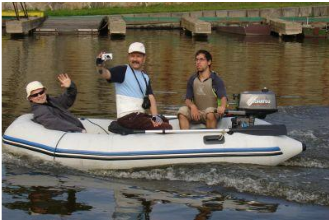
Klienty Centra Paraple po Vltavě s nadšením vozil žák školy Jaroslava Ježka, který se člun naučil obdivuhodně rychle ovládat