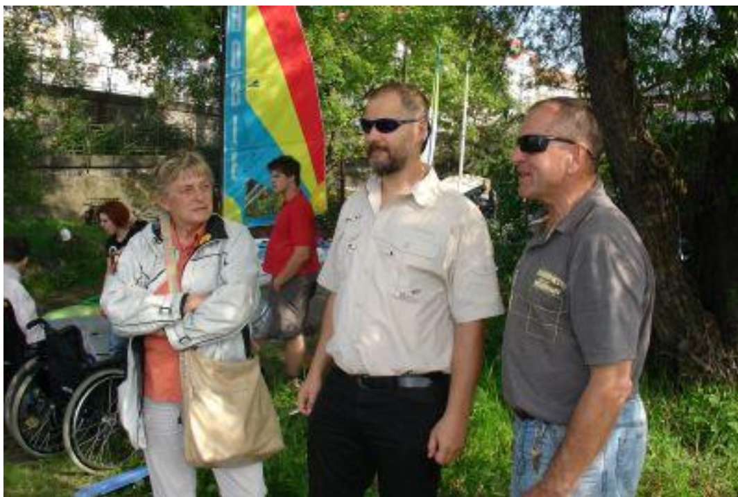
Do Centra sportovních aktivit zdravotně postižených zavítal i rektor UK Václav Hampl (uprostřed)