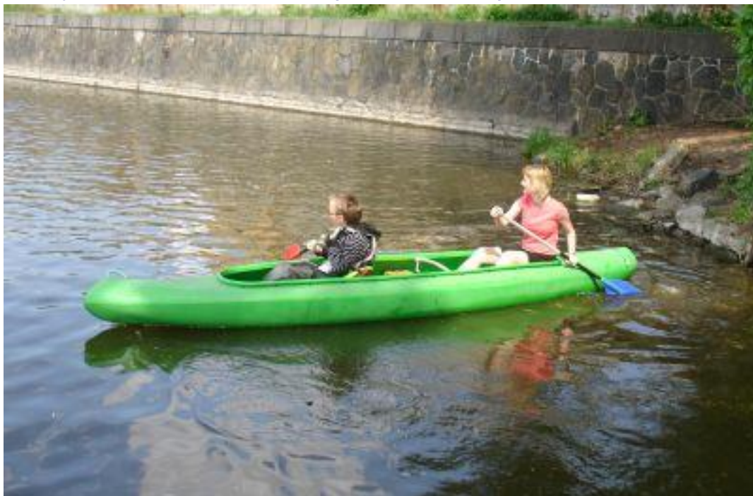
Na kanoe vzaly děti studentky tělesné výchovy PedF UK, které přišly na akci jako dobrovolnice