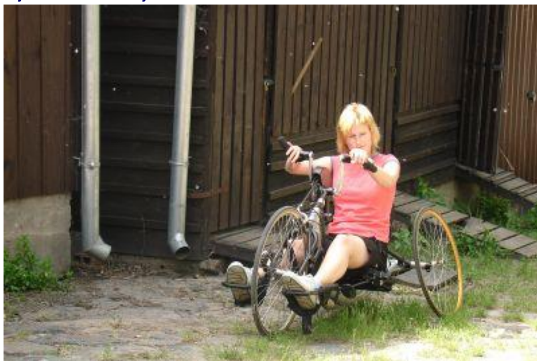
Kolo pro handicapované si vyzkoušeli i zdraví studenti