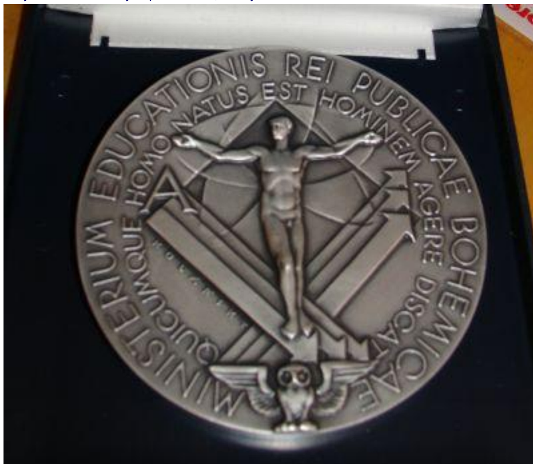
Autorem návrhu medaile je akademický sochař Zdeněk Kolářský (Lucie Kettnerová)