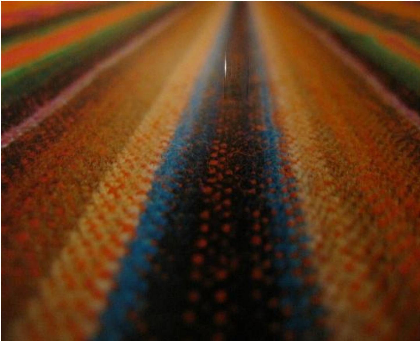
Jerez Carlos, Španělsko: Nappe interminable