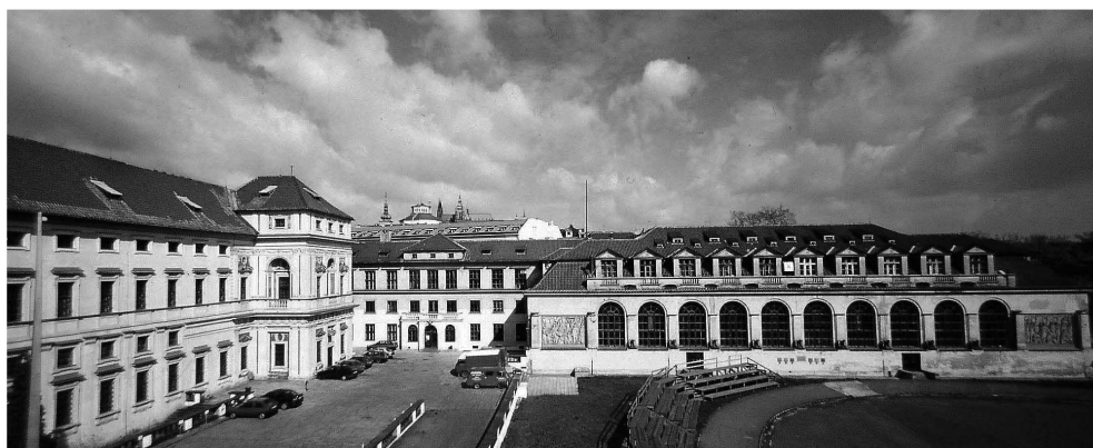
Tyršův dům na Újezdě

Brzy po únorovém převratu v roce 1948, zřejmě v souvislosti s rostoucí politickou rolí vrcholového sportu, vzniká potřeba vysokoškolského vzdělání trenérského zaměření, a tak vzniká v roce 1953 Institut tělesné výchovy a sportu (ITVS), jako čtyřleté „sólo“ studium TV.