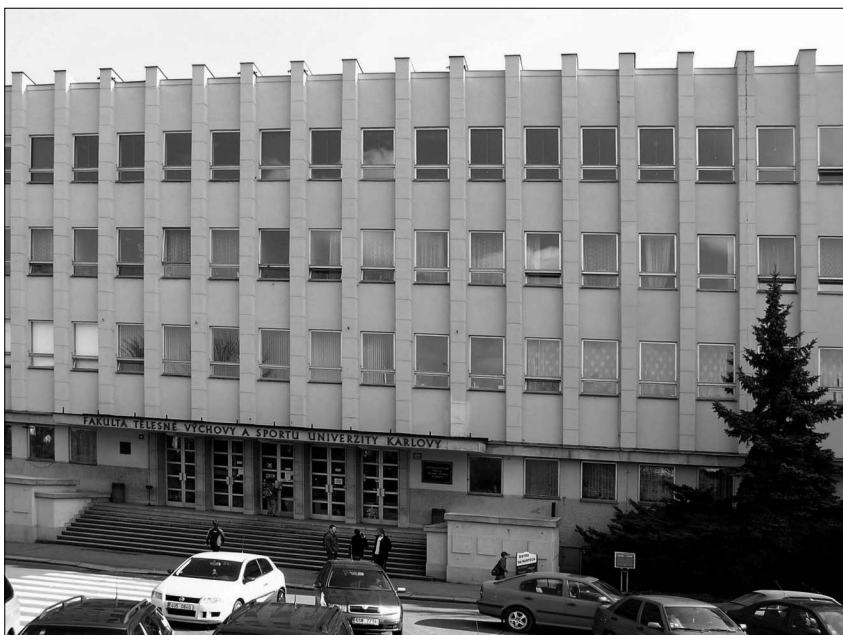
„Nová“ budova FTVS UK ve Veveřslavíně