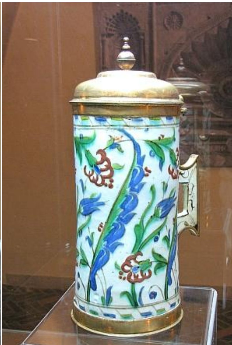
holba, polévaná keramika, Turecko, 16. století

Kolekce pro tuto výstavu vznikala v průběhu roku 2009, ale spolupráce fotografa Jana Brodského s Českým egyptologickým ústavem není jeho první, v letech 1985 – 89 byl fotografem Českého, tehdy ještě Československého egyptologického ústavu v Praze a v Káhiře, se kterým obnovil spolupráci v roce 2004. Podílel se na vzniku odborných publikací pro nakladatelství Slovart, pro které fotografoval koptskou a islámskou architekturu v Egyptě, v letech 2005 – 2009 vytvořil soubor fotografií královských soch Staré říše z Egyptského muzea v Káhiře a kolekci fotografií káhirské islámské středověké architektury. Je autorem řady odborných a uměleckých fotografických publikací, spolupracuje s předními českými i zahraničními muzei a galeriemi, pedagogicky působil na Univerzitě Jana Evangelisty Purkyně v Ústí nad Labem.