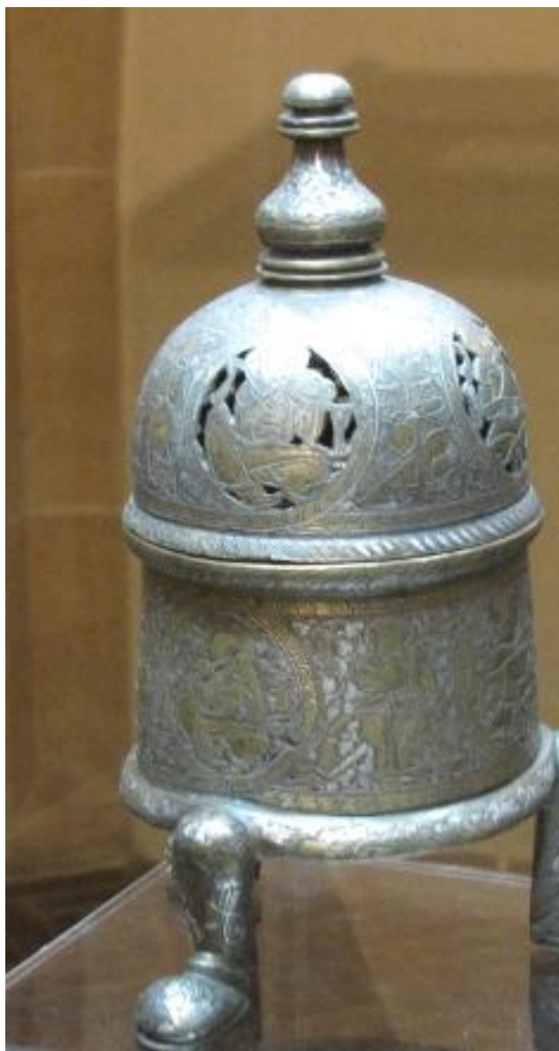
vykuřovadlo z bronzu, Sýrie, 13. století