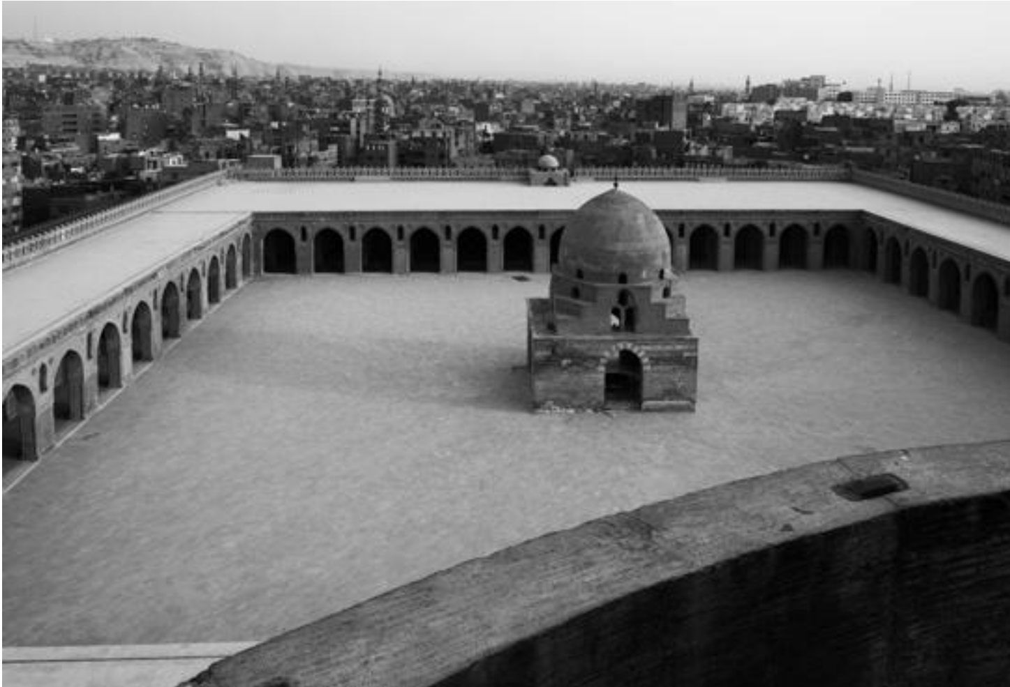
Mešita Ahmada ibn Túlúna (876), nádvoří s Ládžínovou fontánou (1296), © Jan Brodský