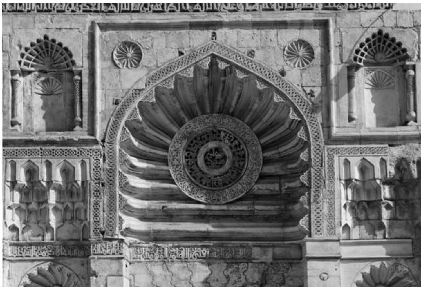
Mešita al-Aqmar, průčelí (1125)