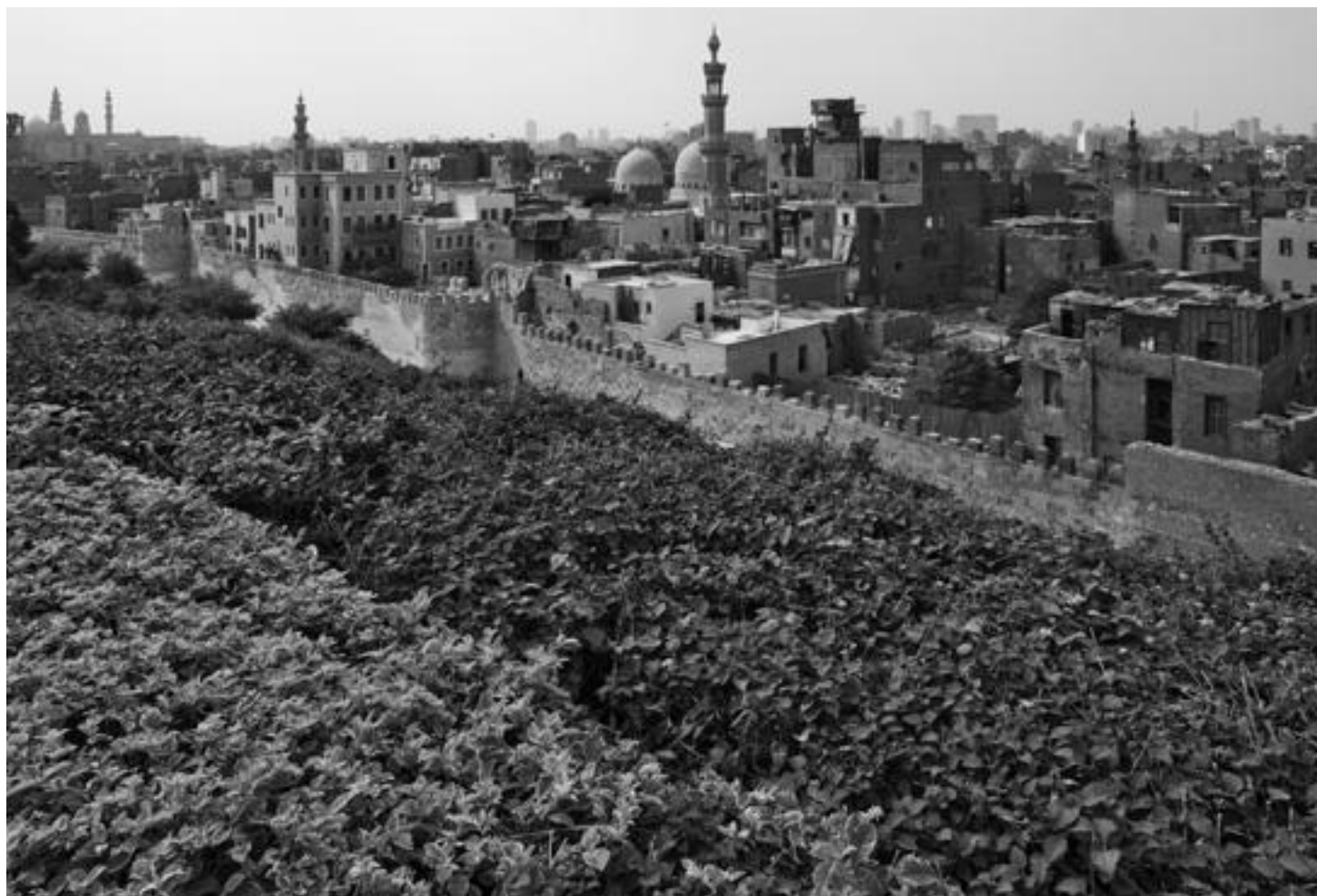
Pohled na východní hradby fátimovské Káhiry z Azharského parku, © Jan Brodský