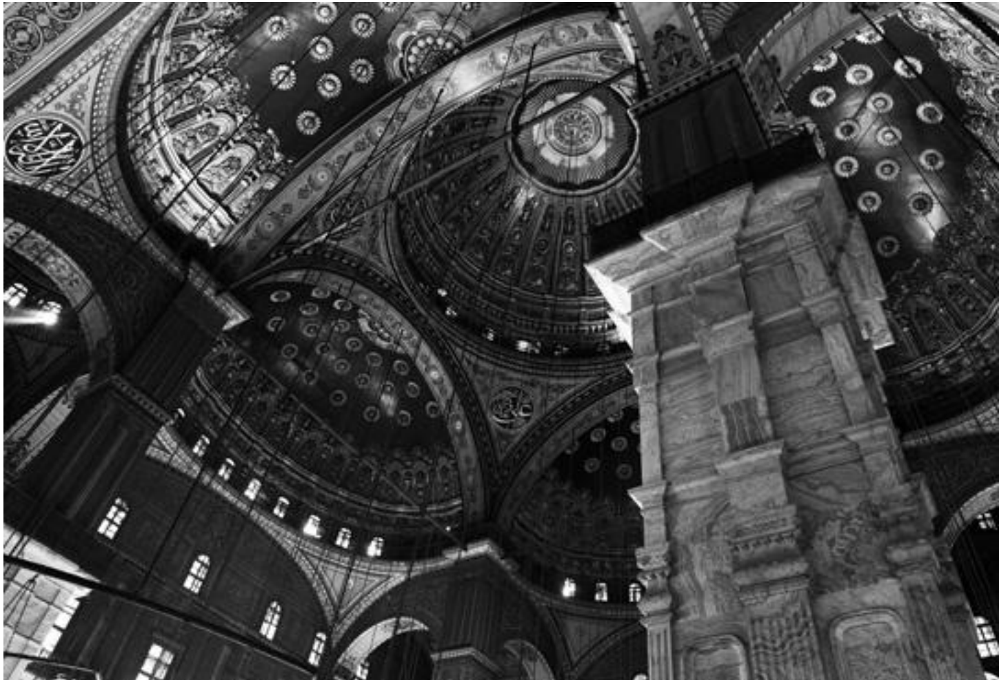
Mešita Muhammada Alího, interiér (1824–48)