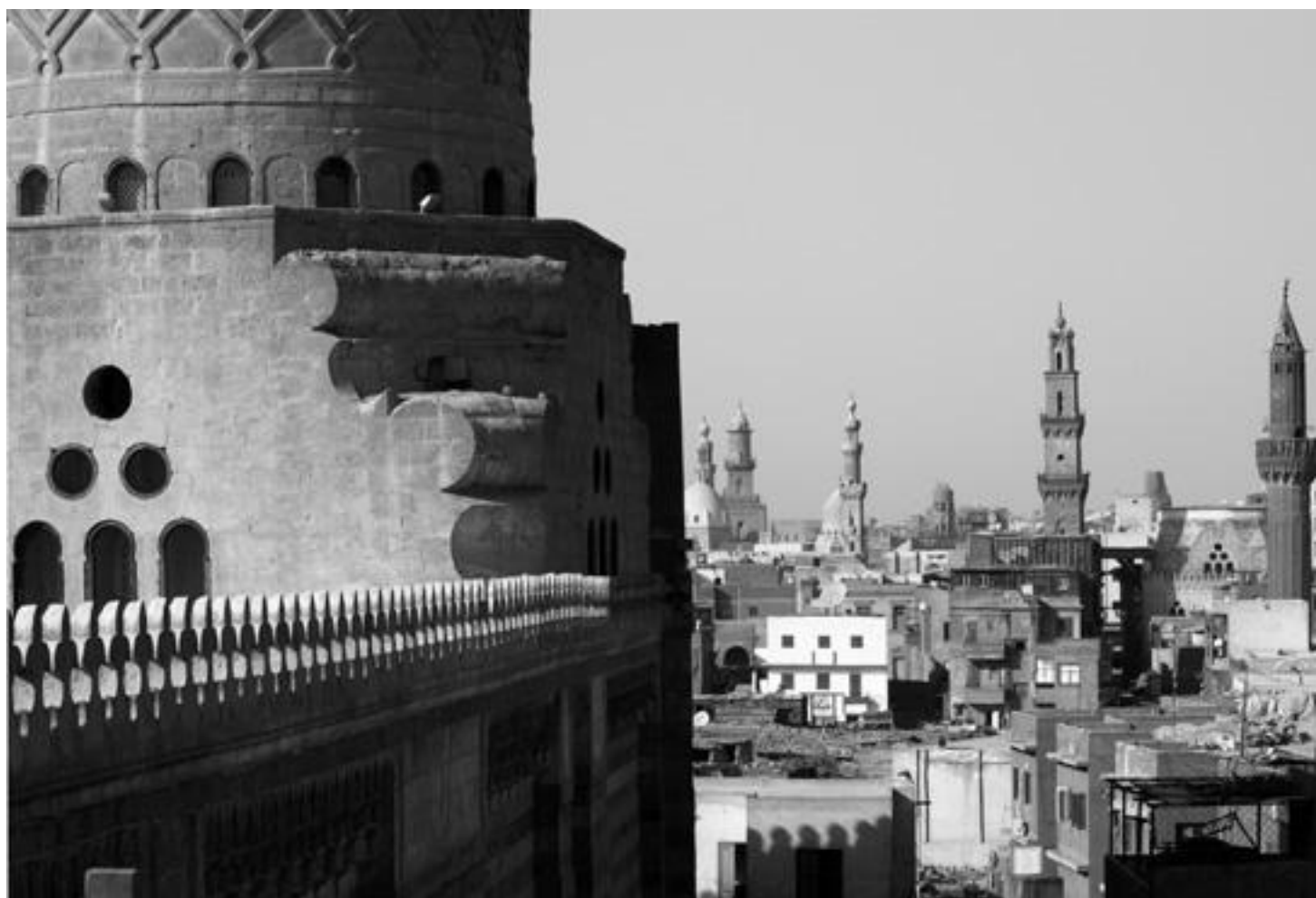
Al-Mu'ajjadūn komplex (1420) a fátimovská Káhira v pozadí

Jaké byly důvody vzniku pracoviště egyptologického ústavu v Káhiře tenkrát před 50 lety a jak se jeho poslání proměnilo teď po půl století? Nebo je pořád stejné? Vždyť vlastně předmět bádání, což jsou zřejmě dějiny a kultura starověkého Egypta, vykopávky a to všechno, co si my laici pod tím představujeme, je pořád to samé.