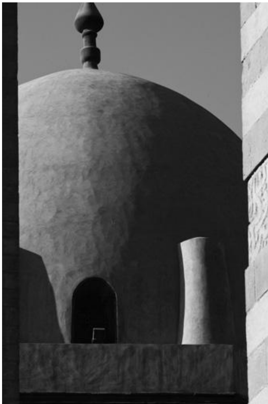
Qaláwúnův komplex, kupole (1285)

Výstava je rozdělena do několika celků. Co tady návštěvníci uvidí, jak budou postupovat výstavou od východu - ne k západu, ale zpátky k východu?