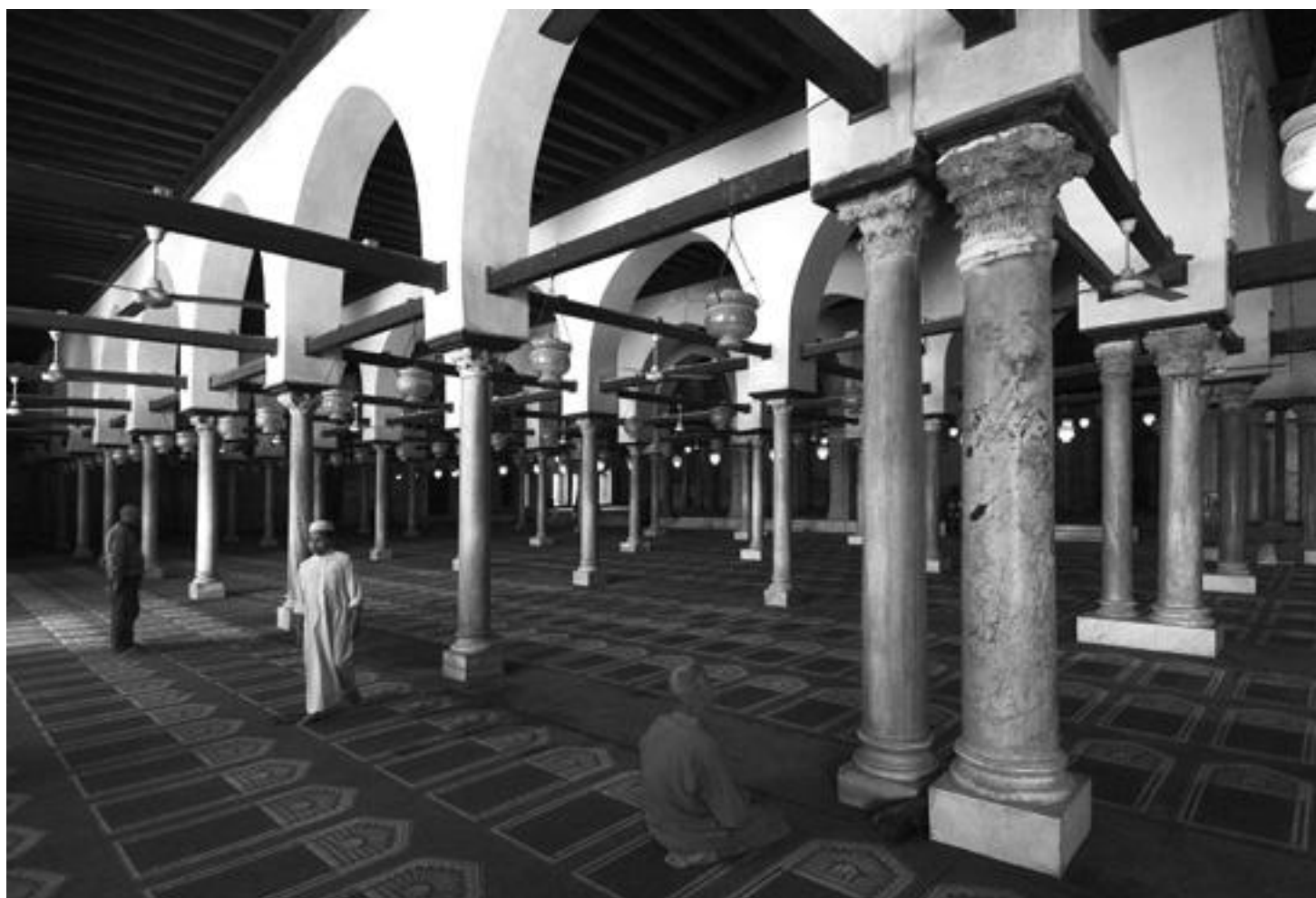
Mešita al-Azhar, interiér, sloupová před mihrábem (970)

Výstava souvisí s touto knihou a tato kniha souvisí s výzkumným grantem, který Český egyptologický ústav má. Na co konkrétně byl grant zaměřen?