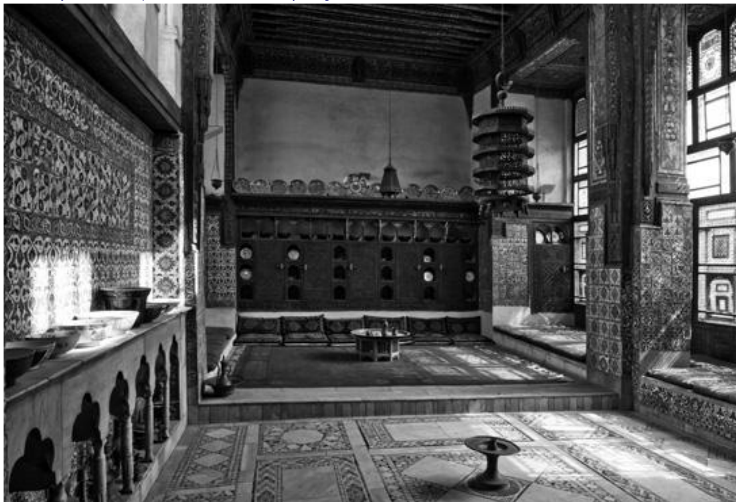
Bayt as-Sihajmi, bývalý rodinný dům, jídelna (1648 a 1796)

nevyhrál. Egyptská komise údajně řekla, že je na Egypt příliš sofistikovaný; v tomto případě bylo využití tradiční architektury a ornamentu pro velmi moderní stavbu myslím geniální.