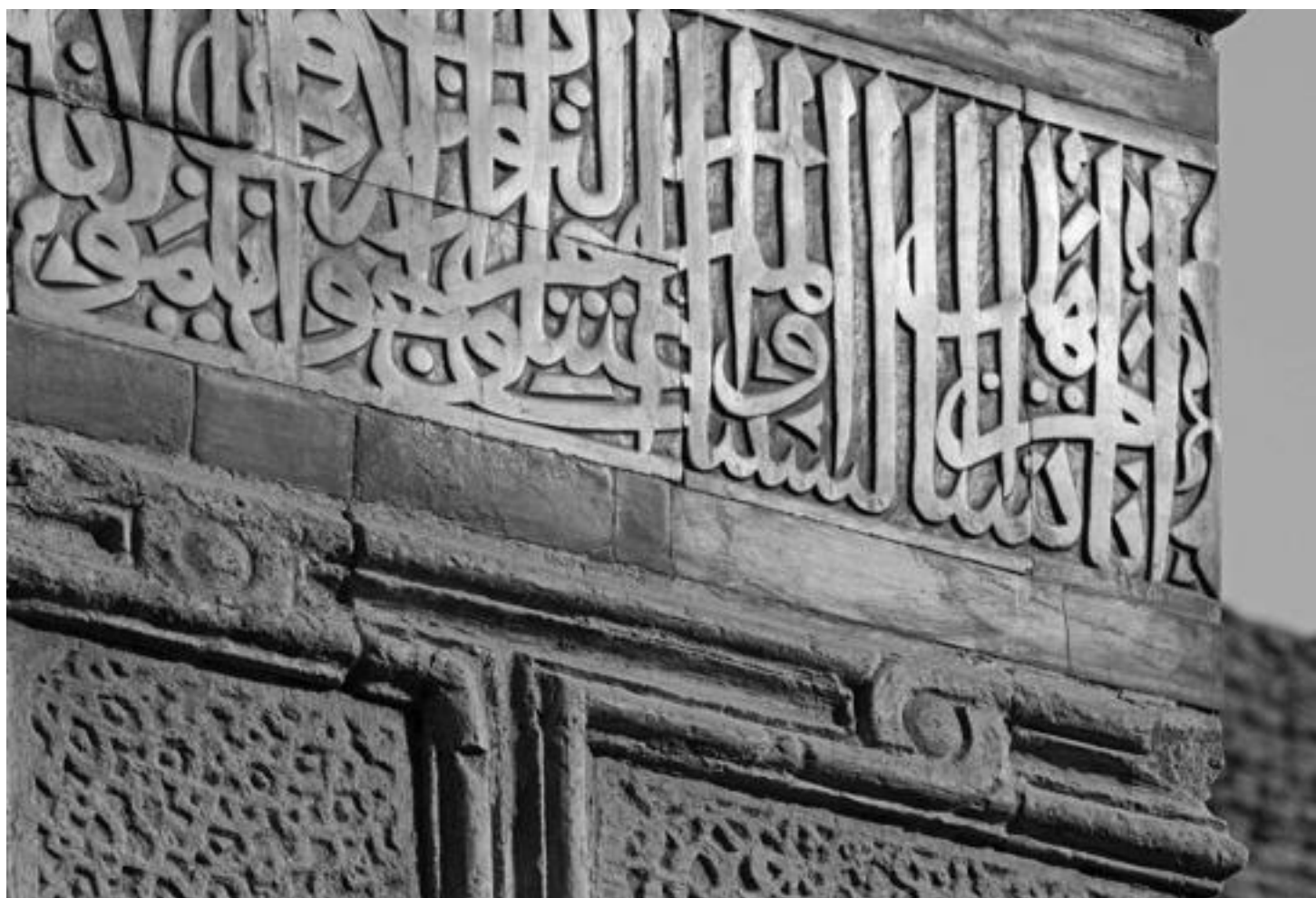
Sabil-kuttáb Chusráwa paši, dekorativní nápis na fasádě (1535), © Jan Brodský

Zmínili jste ze středověké Káhiry určité typy obytných budov a civilních a sakrálních staveb. Mají tyto typy své pokračovatele? Jsou nové moderní stavby inspirované tradičním pojetím funkce nebo stylu středověké káhirské architektury? Jak vůbec vypadá současná káhirská architektura?