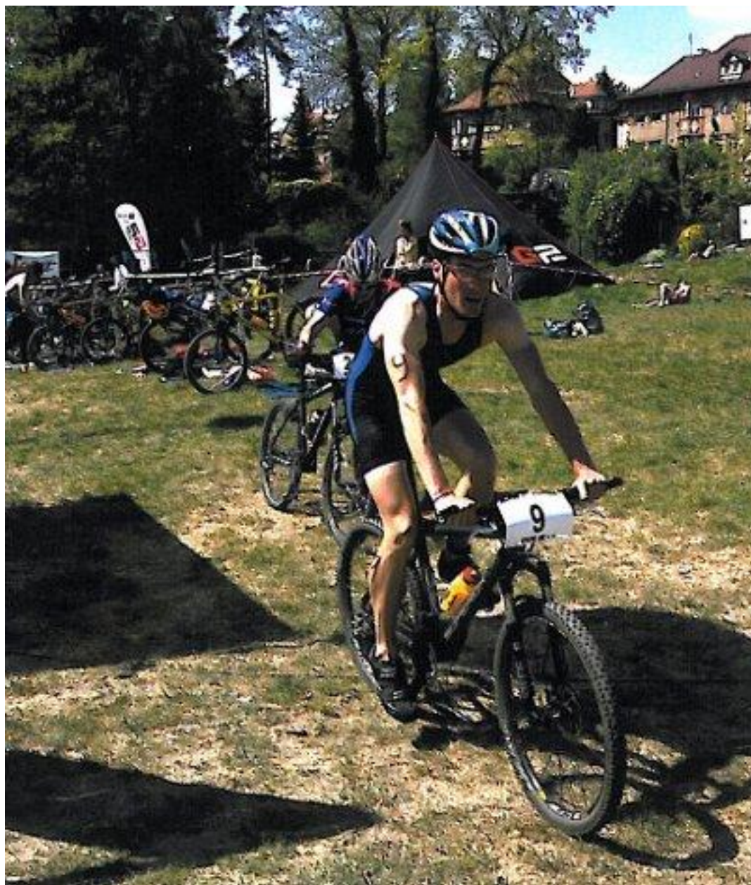
Triatlon, nový sport v akademickém prostředí, v historii vysokoškolského sportu funguje od r. 1990