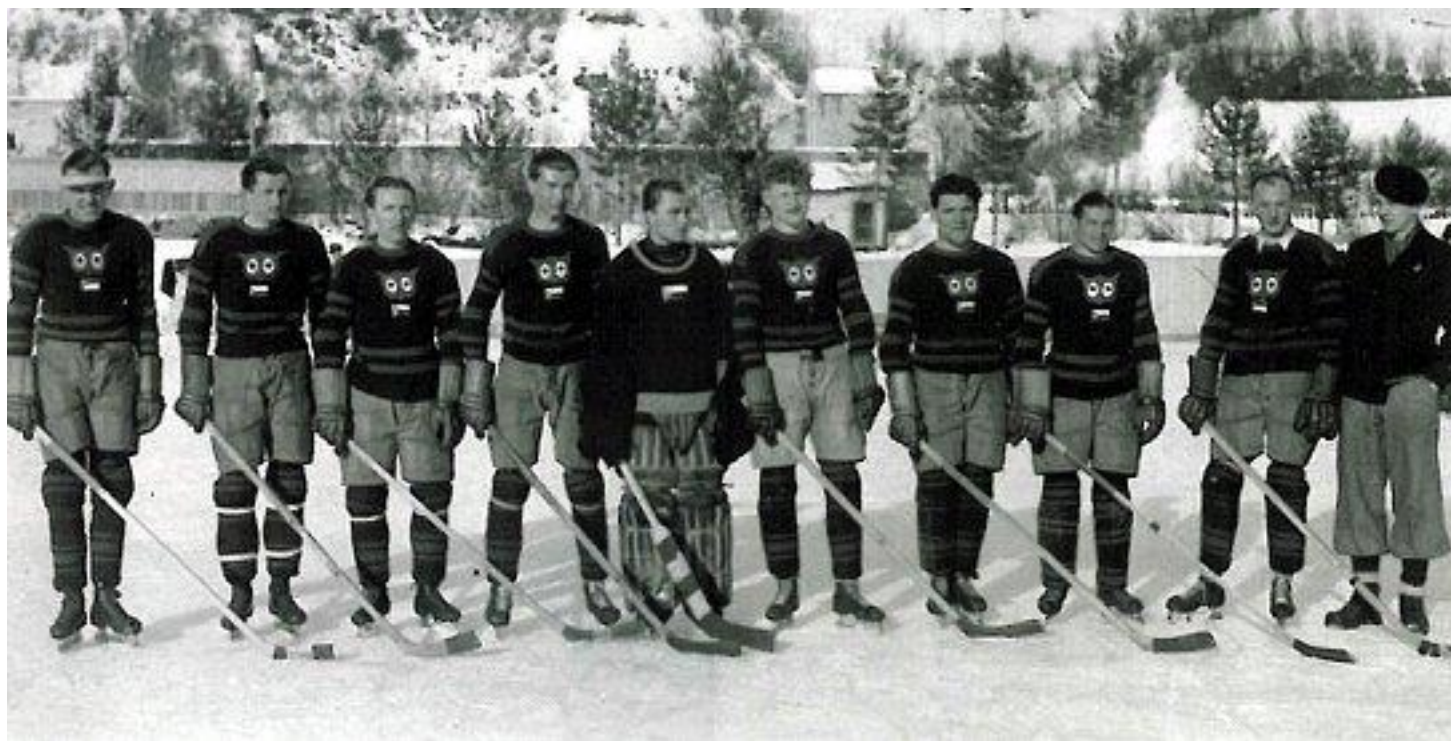
Reprezentační družstvo vysokých škol ČSR (III. mezinárodní akademické mistrovství, Bardonecchii, 1933